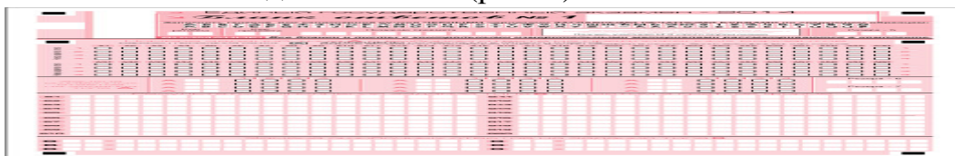
Рис. 8. Область замены ошибочных ответов на задания типа А

Можно заменить ошибочно отмеченный ответ и поставить другой. Замена ответа осуществляется заполнением соответствующих полей в области замены ошибочных ответов на задания типа А (рис. 8).