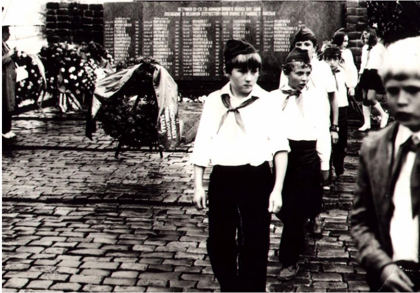
Обелиск 70-ти летчикам, погибшим при освобождении г. Лиепая. День открытия 28 июля 1978г.