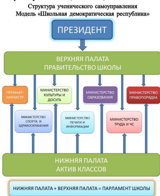
Схема 1. «Модель ученического самоуправления в виде президентской республики»

В настоящее время, в школе действует модель ученического самоуправления – «Школьная демократическая республика» (схема 1).