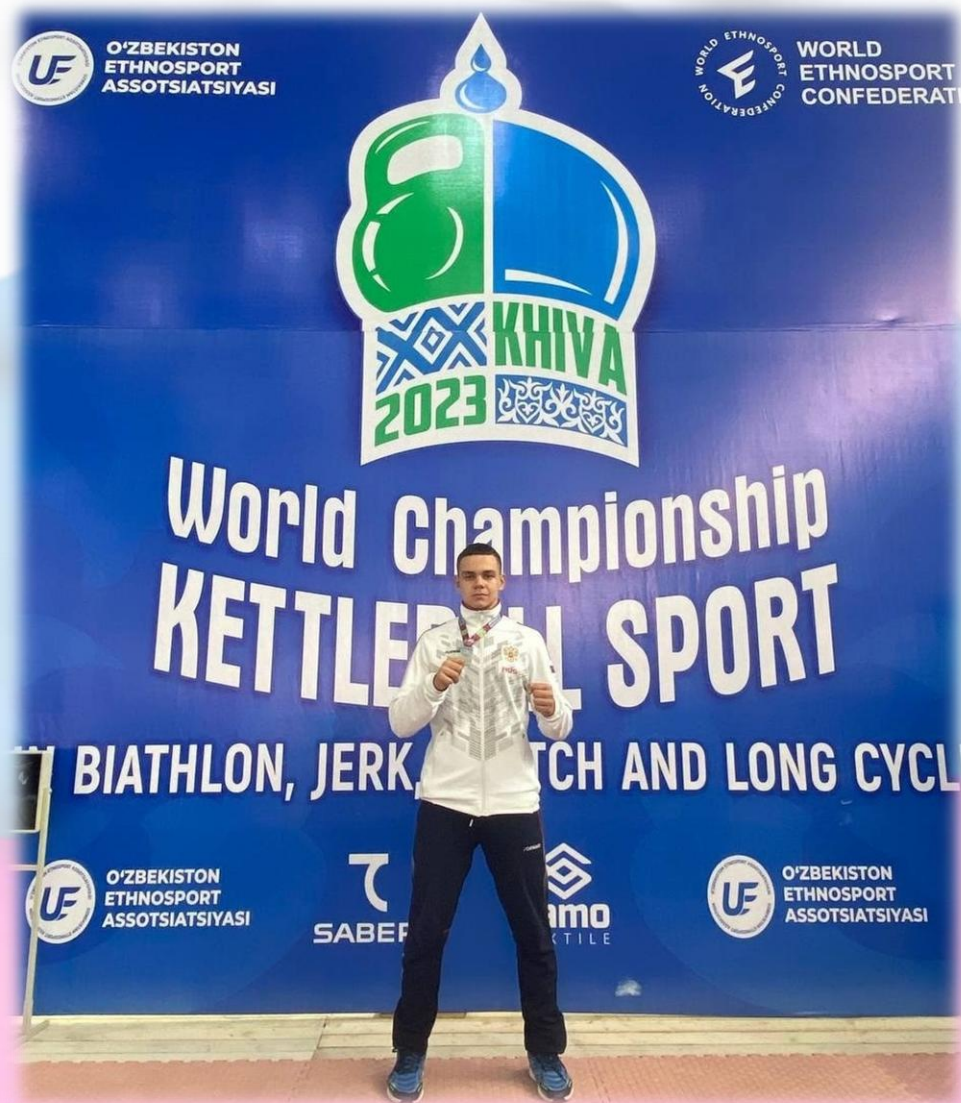
Микряков Михаил Чемпион Мира

Двукратный чемпион Мира по гиревому спорту